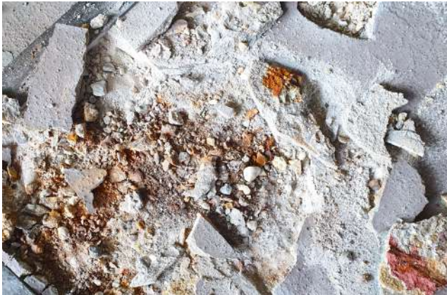
Bitume durch Abrieb gelöst - Beton wurde durch Chloride komplett zerstört