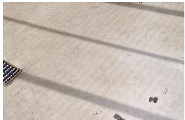
Nach geraumer Zeit entstehen große sichtbare Schäden

Typische Schäden an Garagenböden-Beschichtungen