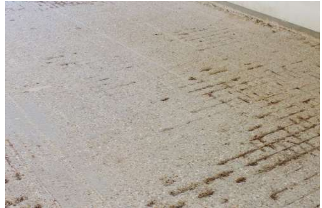
Beschichtung und Betonoberfläche wurde bis auf die Armierung abgerieben

OS 8 10 11 Beschichtung stark beschädigt.