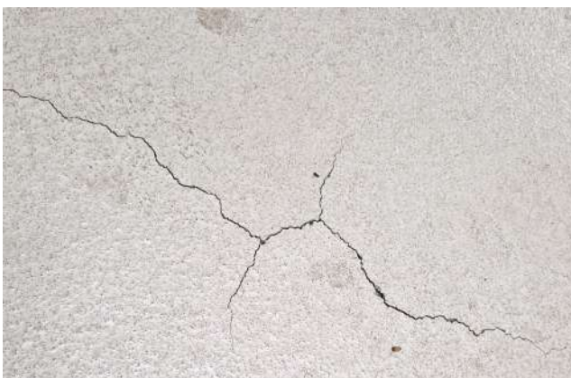
Risse beginnen sich in der Epoxidschicht zu bilden

OS 8 10 11 Beschichtung stark beschädigt.