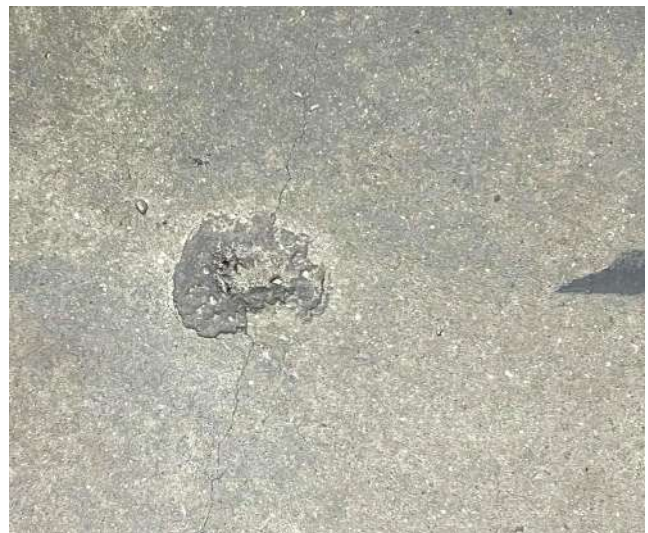
Rissbildung - Beton ist ungeschützt